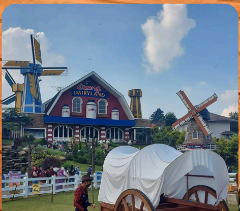
Cimory Dairyland Riverside