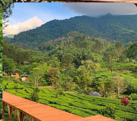
Agrowisata Gunung Mas