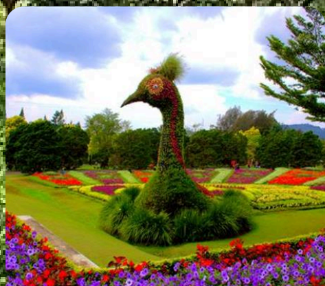
Taman Bunga Nusantara