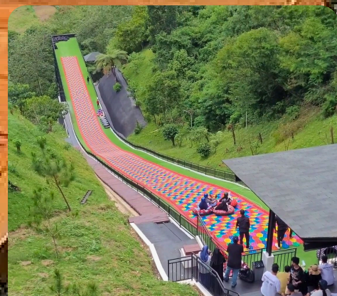
The Nice Funtastic Park